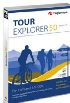
TOUR Explorer 50 Deutschland, Version 8.0 Maßstab 1:50.000