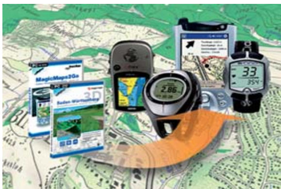
Abbildung: Import und Export von GPS-Daten auf mobile Geräte

Wer ein GPS-Gerät hat, kann auf einen maßstabsgetreuen Ausdruck verzichten. Per Mausclick lassen sich alle Touren exportieren und stehen unterwegs zur Verfügung. Interessant ist auch der Import einer bereits im Gelände aufgezeichneten Tour in die Interaktiven Kartenwerke. Am PC lassen sich die Strecken im nach hinein nochmals virtuell verfolgen, analysieren und verwalten. PocketPC Besitzer können mit der zusätzlichen Softwareerweiterung "MagicMaps2Go" zu den Touren auch Kartenausschnitte auf die kleinen Helfer laden. Schnittstellen zu diversen Trainingsgeräten wie z.B. Ciclosport-Pulsuhren, Suunto-Uhren und Kettler-Ergometer runden die Möglichkeiten ab.